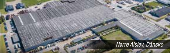
Nørre Alslev, Dánsko